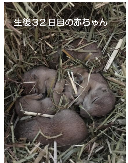
生後32日目の赤ちゃん