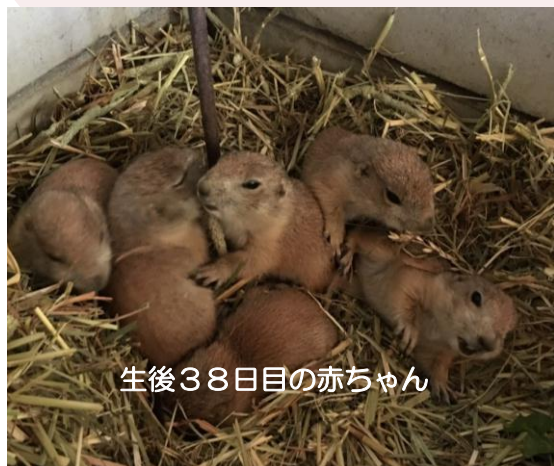
生後38日目の赤ちゃん